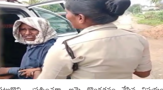
పట్టుకొని ప్రశ్నించగా, ఆమె దొంగతనం చేసిన విషయం వెలుగుచూసింది. వెంటనే గ్రామస్థులు ఆమెను అదుపులోకి తీసుకొని బోనకల్ పోలీసులకు అప్పగించారు.

బోనకల్ అక్టోబర్ 11 నిజం చెబుతాం బోనకల్ మండలం రాయన్నపేట గ్రామంలో దొంగతనానికి పాల్పడిన మహిళను గ్రామస్థులు పట్టుకొని పోలీసులకు అప్పగించారు. చిత్తు కాగితాలు, పాత ప్లాస్టిక్, పేపర్లు, పాత సామాన్లు వేరుచేసే వాళ్లమని చెప్పి గ్రామాల్లో తిరుగుతూ తాళాలు వేసి ఉన్న ఇళ్లను గుర్తించి దొంగతనాలకు పాల్పడుతున్నట్లు తెలుస్తోంది. తాళాలు పగలగొట్టి ఇంట్లో దొంగతనం గ్రామంలో ఒక ఇంటి తాళాలను పగలగొట్టి లోపలికి ప్రవేశించిన ఆ మహిళ, ఇత్తడి, రాతిండి సామాన్లను దొంగిలించిందిని గ్రామస్థుల అప్రమత్తతతో